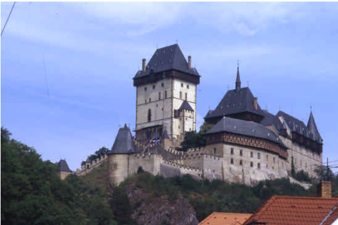
Château de Karlstejn

A Veltrusy (ou il y a un joli camping en bord de rivière en allant vers la résidence) nous visitons le parc du château, cette résidence durement touchée par les inondations de 2002 ne se visite pas cette année encore . Mais vaut la peine pour le parc et les bâtiments recouverts de crépi rouge et blanc .