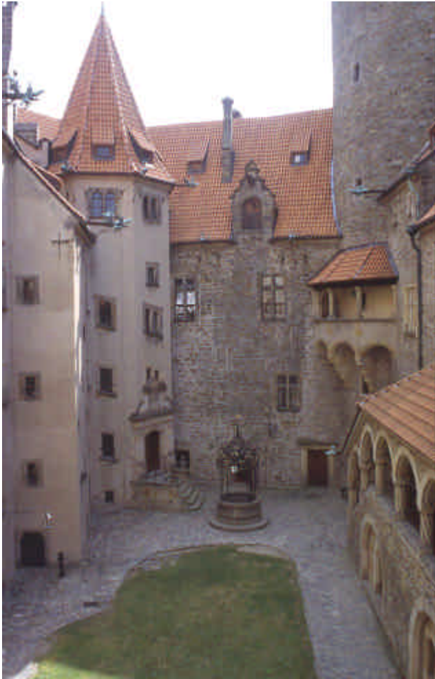
Cour intérieure du château

SV Kopecek - Nove Mesto au sud de Nachod 203 km