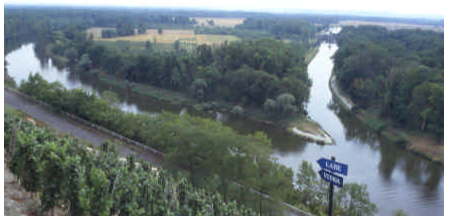
Confluent Vltava et Elbe

Arrêt à Melnik pour voir la place centrale, le château mais surtout la vue sur le confluent Vltava et Elbe depuis le belvédère des vignes du château. Le magasin de vin où l'on ne peut déguster ( il faut s'adresser au restaurant d'une part, et d'autre part penser au taux d'alcool !!) A Nela hozeves, lors de notre arrêt le château est fermé et il n'est pas possible de dormir calmement à proximité immédiate ; nous filons vers Veltrusy et cherchons la résidence d'été des Chotek.