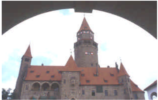
Le château de Bouzov

Opatov, son château avec sa cour et son pont de bois couvert permettant l'accès au parc.