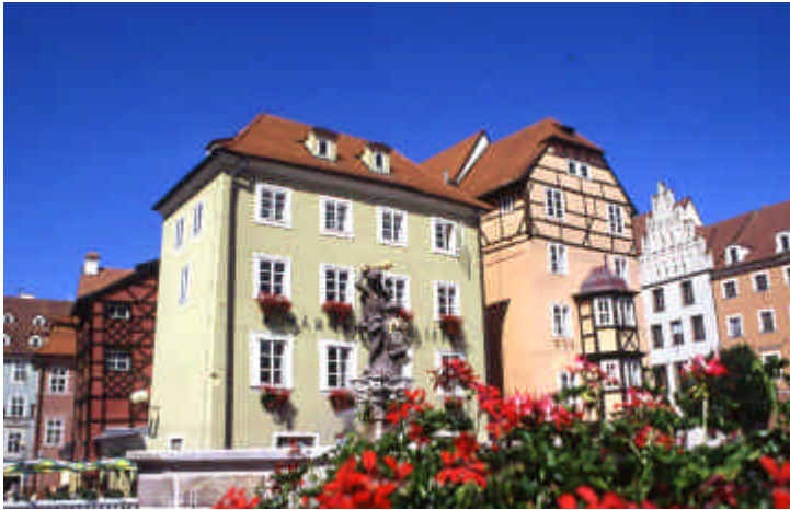
Maisons à colombages de Cheb

Passage et visite de Loket au charme médiéval dans le coude d'une rivière, belle place avec sa colonne de la peste.