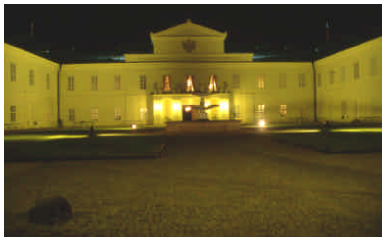
Résidence de Metternich, et aussi la notre pour la nuit !!!

Par une très petite route nous allons jusqu'à Kynzvar ou nous nous installons dans le parc . Ce soir l'ancienne résidence de Metternich est illuminée, il y a un concert .