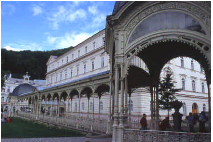
Colonnades à Karlovy Vary