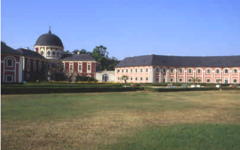
Château de Veltrusy

A Veltrusy (ou il y a un joli camping en bord de rivière en allant vers la résidence) nous visitons le parc du château, cette résidence durement touchée par les inondations de 2002 ne se visite pas cette année encore . Mais vaut la peine pour le parc et les bâtiments recouverts de crépi rouge et blanc .