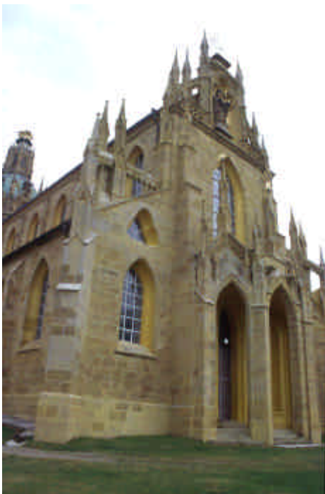
Monastère de Kladrby

Visite de la vieille ville : Place centrale, églises et repas dans un restaurant typique.