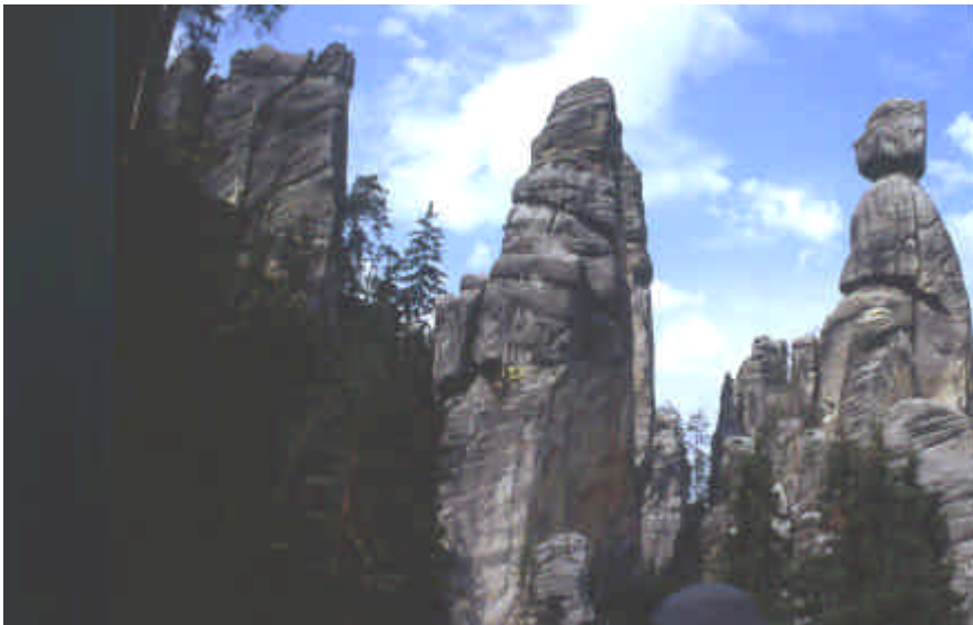
Mons des Géants à proximité de Teplice

Une petite route à quelques centaines de mètres de la frontière de la Pologne nous amène vers les monts des géants. Première ballade (payante, mais nous comprendrons plus tard que c'est normal) vers le grand canyon, l'accès est très bien fait, certains rochers sont accessibles par des escaliers très bien aménagés.