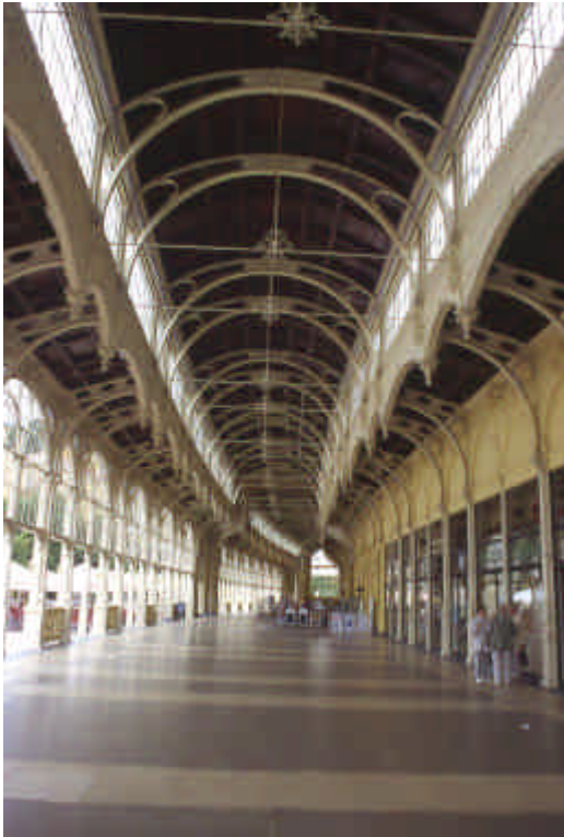
Colonnades à Marienbad