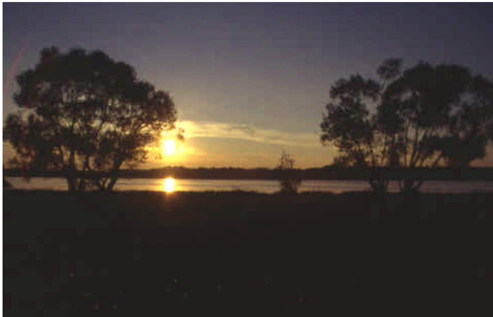
Coucher de soleil sur lac Okrouhla

L'ensemble des photos dans le récit ci-dessus sont des diapositives scannées.