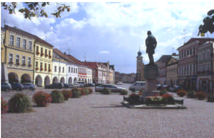
Place de Litomyšl