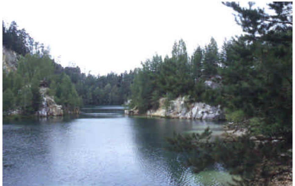
Lac dans le mont des géants

Nuit : Teplice nad Metují Idem à l'autokemp