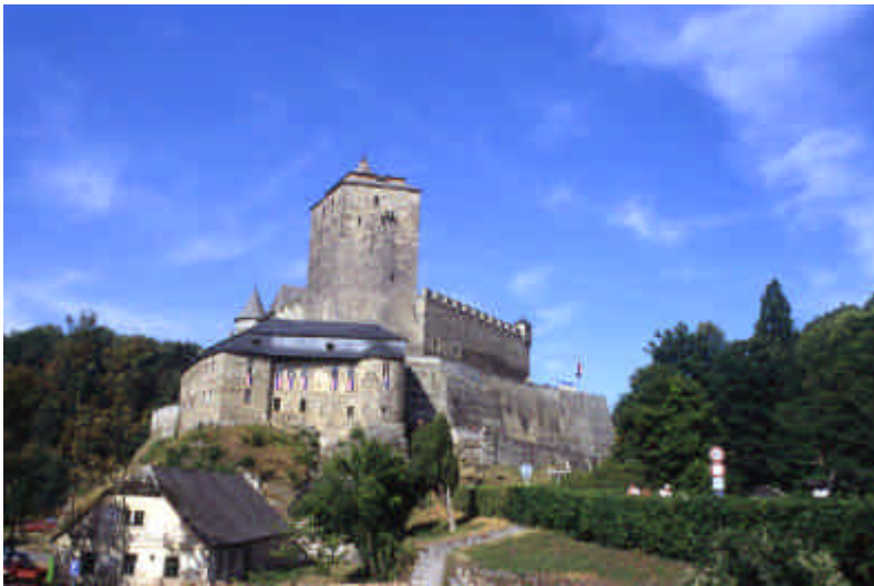
Château de Kost Sobokta

Par la route nord nous rejoignons Trutnov, arrêt à Jicin avec sa place centrale, ses nombreux magasins presque tous tenus par des asiatiques . Arrêt à Kost pour voir le château médiéval . Nous nous présentons vers 19h30 au restaurant, mais il est déjà trop tard . On nous propose de manger des grillades sur la terrasse avec le personnel du château (en tenue médiévale) . Soirée sympathique mais avec beaucoup de difficultés pour se comprendre !! Nuit : - Kost Sobokta Au pied du château (coté arrière) sur le parking de verdure, (payant le matin à partir 9h) calme, restaurant vers l'entrée du hameau.