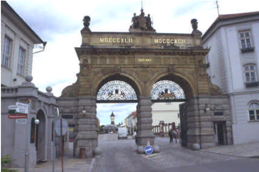
Entrée de la brasserie de bière à Plzeň

Arrêt à Plzeň pour visite de la plus grande fabrique de bière de Tchéquie, présentation en anglais, une partie musée, une partie production . De très nombreuses galeries souterraines (9 km, mais on ne fait pas tout) avec dégustation au tonneau .